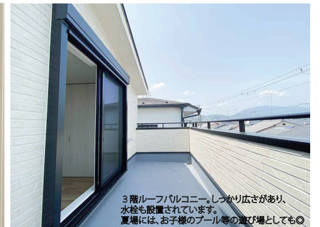
3階ルーフバルコニー。しっかり広さがあり、 水栓も設置されています。 夏場には、お子様のプール等の遊び場としても◎