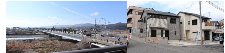
B号地バルコニーからの眺望